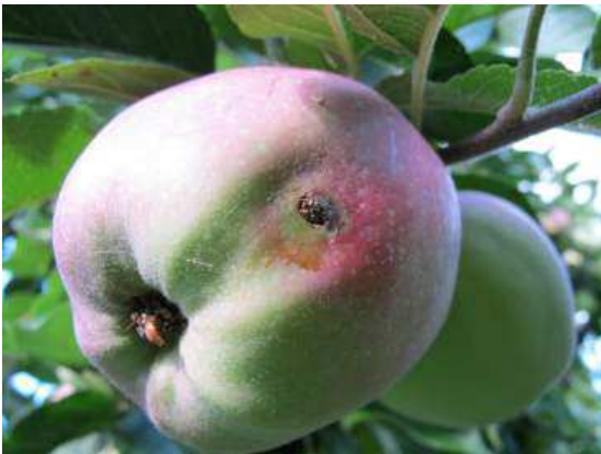
Abbildung 1 Das typische Schadbild einer Raupe

Ab Juli lässt man auch Wellpappe an den Stämmen anbringen. Darin nisten sich die Raupen zur Verpuppung ein. Eine regelmäßige Kontrolle und Erneuerung ist notwendig um verpuppte Larven zu entfernen.