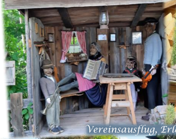
Vereinsausflug, Erlebnisdorf Winkelbauer