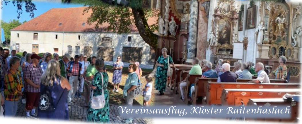
Vereinsausflug, Kloster Raitenhaslach