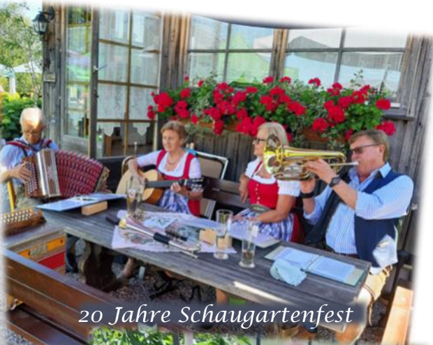
20 Jahre Schaugartenfest