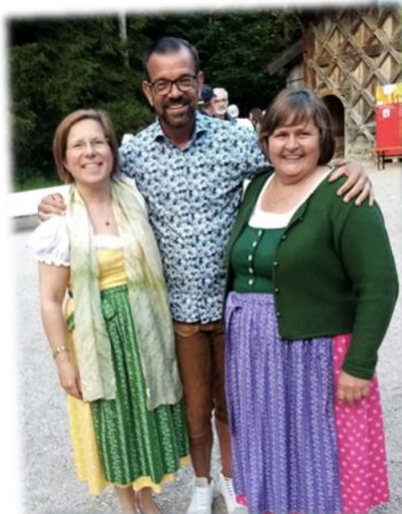
Verleihung der Urkunde: „Natur im Garten“