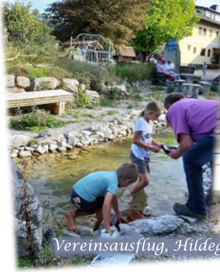
Vereinsausflug, Hildegard Kräutergarten, Mariengrotte