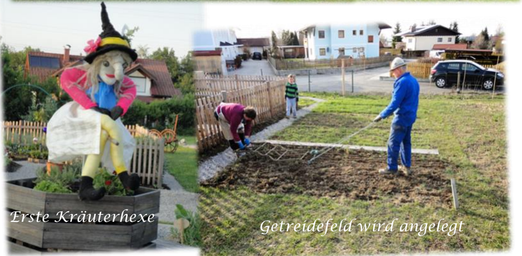
Getreidefeld wird angelegt