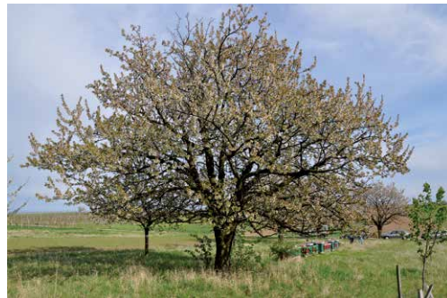
Baum zur Blüte im Haniftal Wuchs: mittelstark, breit wüchsig, Krone flach kugelig bzw. kugelig

Die Joiser Einsiedekirsche ist eine der bekanntesten Kirschsornten in Jois und in den angrenzenden Gemeinden im nördlichen Burgenland. Sie wird seit ca. 100 Jahren in dieser Gegend zwischen dem Leithagebirge und dem Neusiedler See angebaut. Es handelt sich vermutlich um einen Zufallssämling. Zum ersten Mal pomologisch beschrieben wurde sie von BODO (1936), der sie als eine der besten Markt- und Einsiedekirschen bezeichnet. Einsiedekirschen sind schwarze, halbfeste bis feste Knorpelkirschen, deren Früchte sich insbesondere für die Verarbeitung zu Marmelade, Kompott oder Saft eignen.